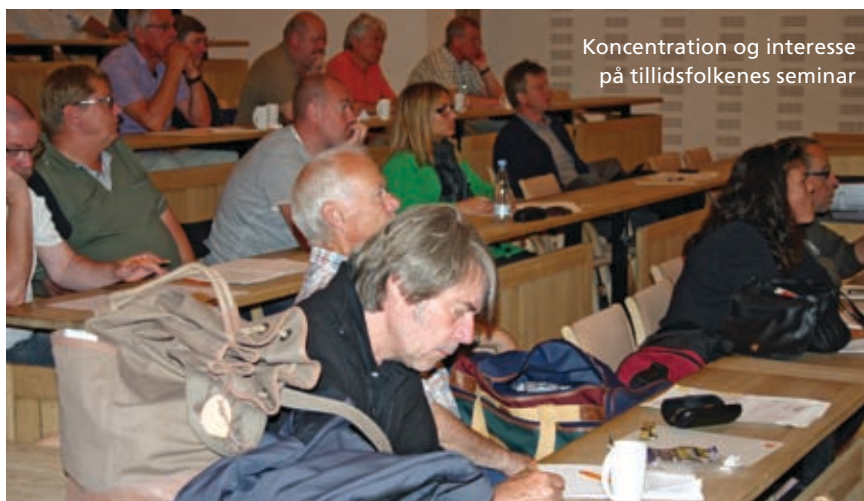
Koncentration og interesse på tillidsfolkernes seminar

Midt i maj var FOA 1s tillidsrepræsentanter på seminar på LO-skolen. Denne gang var hovedemnet den Agenda, som FOA's kongres vedtog i efteråret.