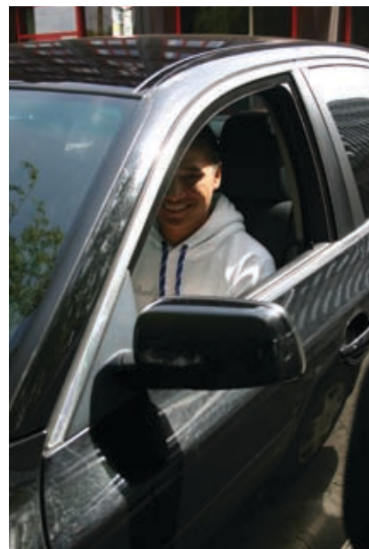
En ung og meget glad bilist, der nåede tilbage til bilen, lige inden Reno ellers ville have udskrevet en bøde